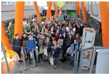
Défi académique TEKNIK 2018