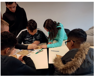
Atelier de coopération Discovery