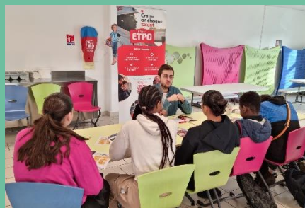
Stage dating au collège Ernest Renan de Saint-Herblain

Un accompagnement sur mesure pour ouvrir le champ des possibles co-construit avec les équipes pédagogiques des écoles