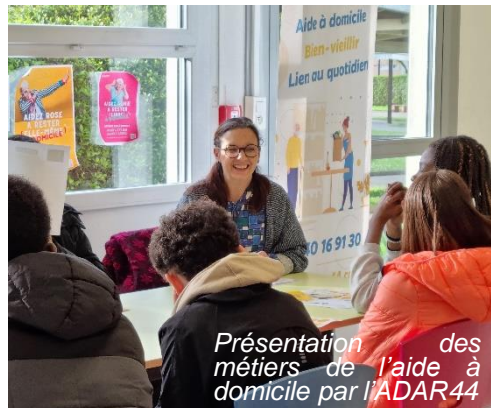
Présentation des métiers de l'aide à domicile par l'ADAR44