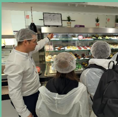
Découverte des métiers de la restauration avec SODEXO

L'accompagnement proposé au collégien est déconnecté de ses résultats scolaires et s'adapte à lui, en utilisant son langage et ses codes et en prenant en compte ses souhaits.